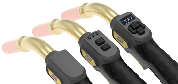
Exeor MIG 4.0G 2 , 4.0G 2 CX och 4.0G 2 DX-brännare