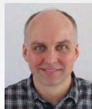
Morten Andersen Reservedele