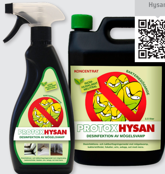
Borttagning och desinfektion av mögelsvamp