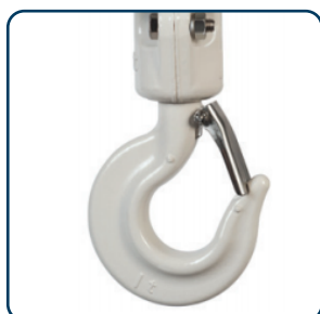
Vit epoxy på lastkrokan