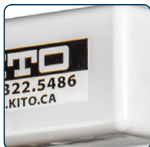
Vit epoxy färg