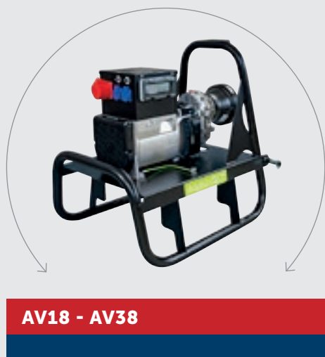
AV18 - AV38