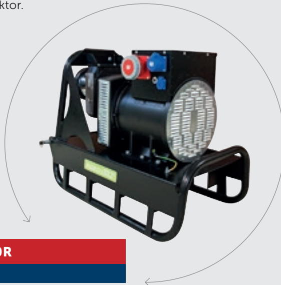
AV65R / AV80R