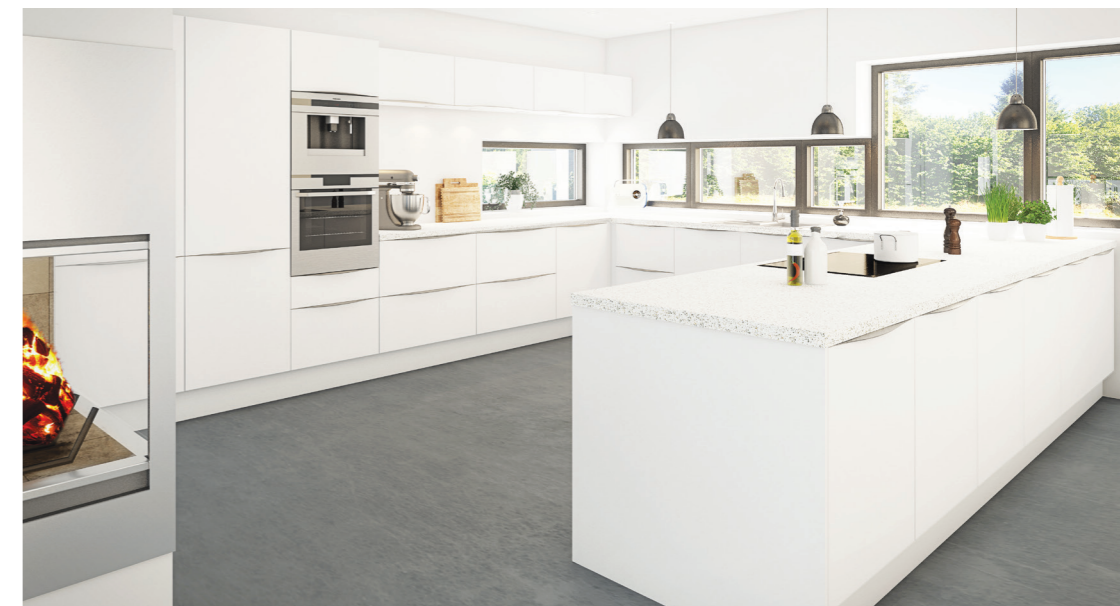
0034 - SetaLac Hvid