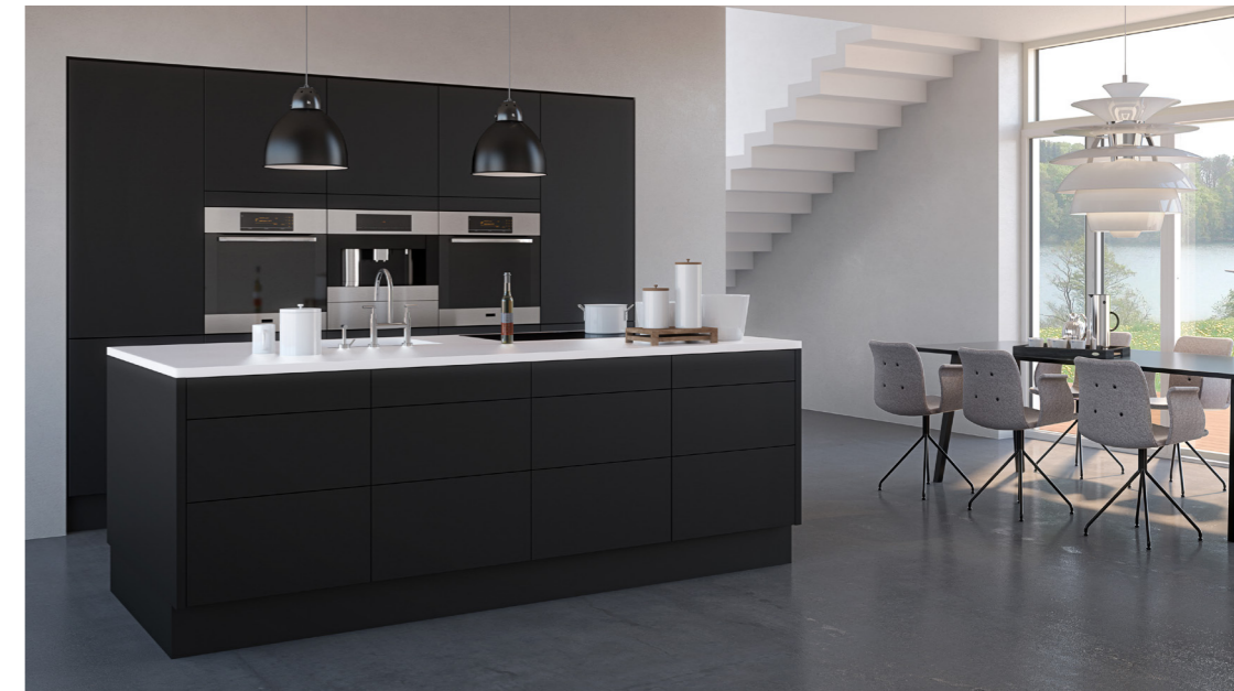
0038 - SetaLac Sort

Fronten tilbydes i 3 forskellige farver: Sort, grå og hvid.