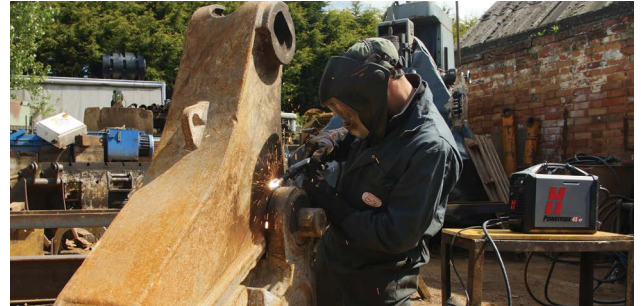
Vedligeholdelse og reparation