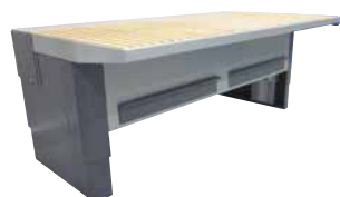
UFH-E Bordplade med sug

Kan leveres i følgende standardversioner: