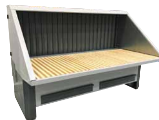
UFH-E-BS-ISO Bagvæg med sug samt loft og sider med lyd-isolering