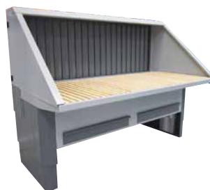
UFH-E-BS Bagvæg med sug samt loft og sider uden lyd-isolering