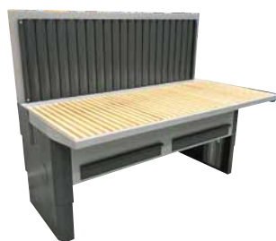
UFH-E-B Bagvæg med sug