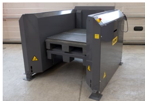
1060x750x175 mm paller

Virksomheder som Grundfos, Carlsberg, Coca Cola, Volvo, Nestlé, Chanel, Haribo, Pfizer, Siemens og Miele bruger allerede PALOMAT® til at effektivisere deres palleflow.