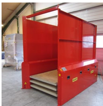
2400x1200x160 mm platforme