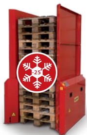
Pallehåndtering i miljøer ned til -25 C°