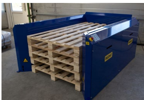
2015x900x137 mm paller

Kontakt din forhandler og lad dem finde PALOMAT® - løsningen til netop dit palleflow