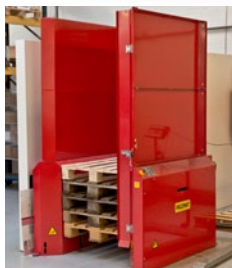
Sikkerhedsoverbygning med luge for 15 paller