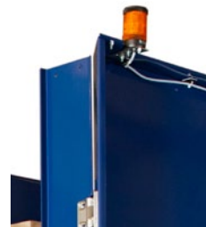
Lystår inkl. max-melder