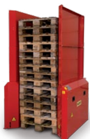
Sikkerhedsoverbygning for 15 paller