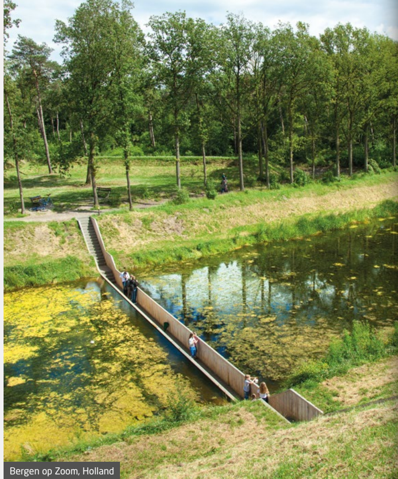
Bergen op Zoom, Holland

Forestil dig træ, der kan erstatte det stadigt mere og mere sjældne tropiske hårdtræ. Træ, der kan erstatte behandlet træ og mindre bæredygtige materialer i nye såvel som eksisterende udendørs projekter. Forestil dig træ, der i kraft af sin utroligt lange levetid, er mere end "blot" CO2 neutralt, ja nærmest "CO2 negativt", og som kan genanvendes sikkert efterfølgende. Dette træ findes allerede - nemlig Accoya®. Verdens førende højteknologiske træ.