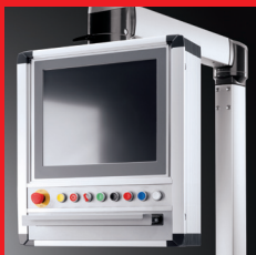
Kapslinger – Monteringskasser, pulte og bærearmsystemer