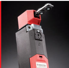
EI – teknik - Endestop og sikkerhedskomponenter