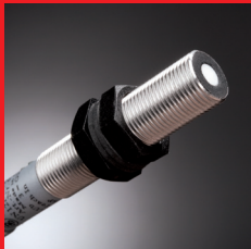
Elektronik – Kompakte intelligente elektroniske Sensorer