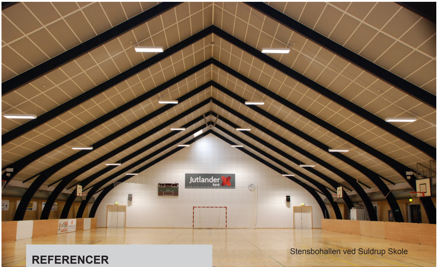
Stensbohallen ved Suldrup Skole