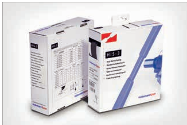
HIS-3 dækker et stort område med få størrelser.