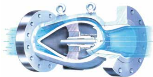
Non slam Nozzlecheck ventil med venturi design – som sikrer et minimalt tryktab over ventilen.

Som videnbaseret virksomhed sørger ProMetal for en kontinuerlig videnopdatering. Vi har tæt kontakt til vores netværk af leverandører samt relevante innovationsmiljøer – for med det i ryggen har vi adgang til deres udviklingsafdelinger samt forsknings- og innovationsresultater.