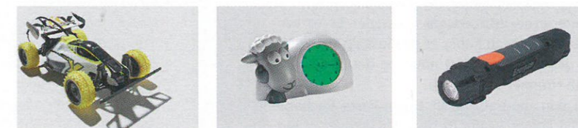
De genopladelige batterier er testet i brug på tre ting, der har forskelligt strømforbrug: en fjernstyret bil, et ur med natlys og en lommelygte.

Sådan har vi gjort → 18 genopladelige AA-batterier er testet i tre forskellige apparater: et børneur med natbelysning, en lommelygte og en fjernstyret bil. Alle batterier er afladet og opladet fem gange inden starten af testen for at sikre, at alle batterier nåede deres fulde opladningskapacitet inden testens start.