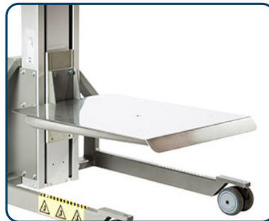
Lastbord i rostfritt eller aluminium