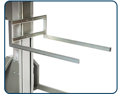
Gafflar fasta eller justerbara, finns även i rostfritt