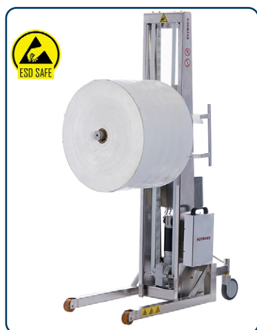
INOX E300 med enkel pikbom

E300 lyftvagnen har många möjliga användningsområden tack vare sitt utbud av manuella och elektriska verktyg inklusive hantering av rullar, trummor, tråg och lådor. Kapslingsklass IP66 för enkel rengöring även med rengöringsmedel.