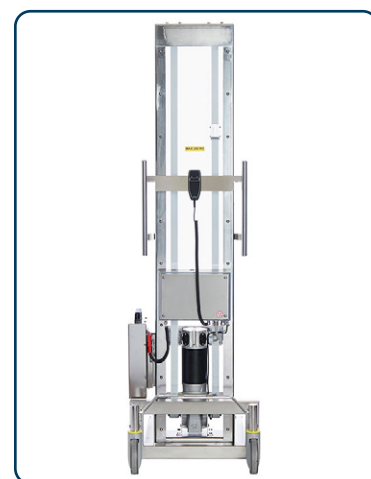
INOX E300 baksida