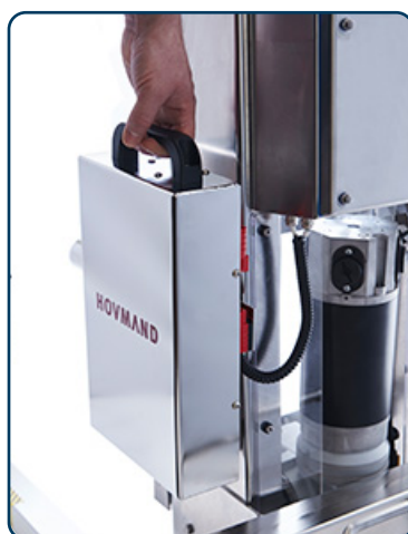
INOX E300 utbytbart batteri