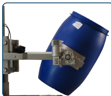
Drivet klämverktyg för tilt av fat/rullar