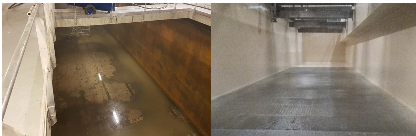
Karr før sandblåsing og belegning. Ladehammeren renseanlegg