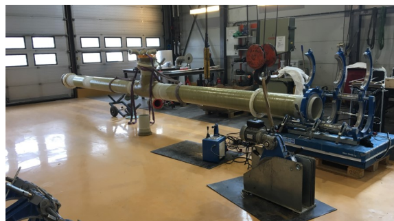
Prefabrikasjon av glassfiberarmert PP-rør (Ø315mm)

topp kvalitet og nøyaktighet i arbeidet.