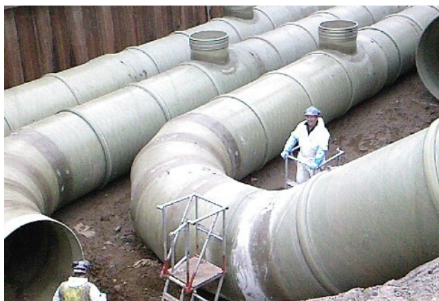
Montasje av kjølevannsrør til Longannet Skottland