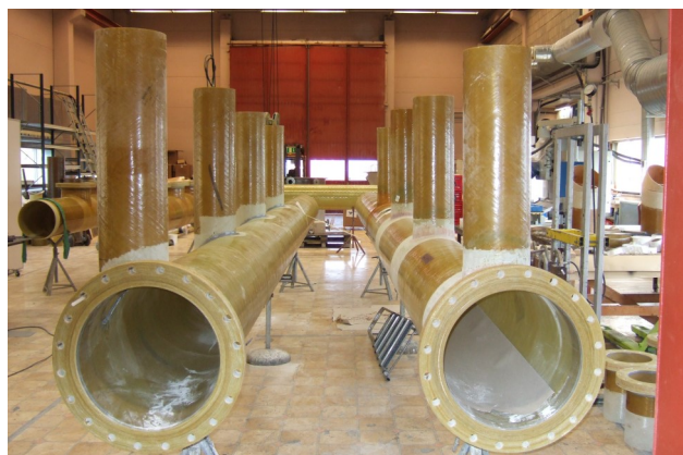
Prefabrikasjon av GRE-rør til kjøle sentral, Bjørvika