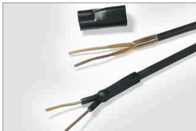
HMT200A tape til forsegling mod fugt.