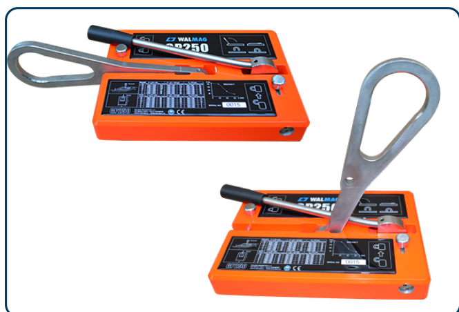
GP-250 Handmagnet med lyftögla

Med WRM-1 kan lättare hantering göras med ett spännband runt vristen och med en kapacitet på 5 kg. MC-2 finns med lyftkapacitet på 70 respektive 90 kg, med manuell excentrisk släppfunktion via handtaget. MC-2S är uppbyggd helt i metall för tuffare miljöer. GP-250 gör det enklare att hantera ännu tyngre plåtar och har en kapacitet på 250 kg vid horisontellt lyft och 80 kg vid vertikalt. Magneten är avsedd för lyft i lastkrok.