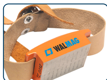
WRM-1 Handmagnet med spännband