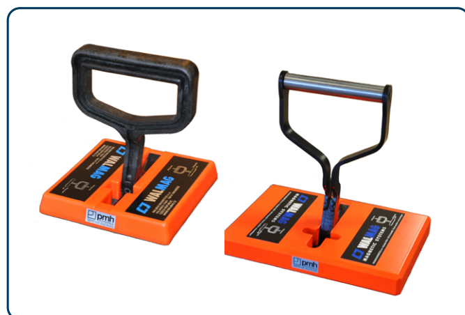
MC-2 och MC-2S Handmagneter