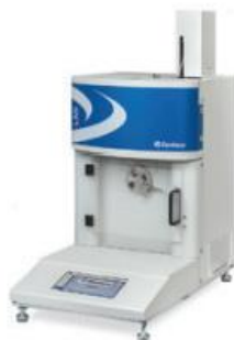
Melt Flow Indexer