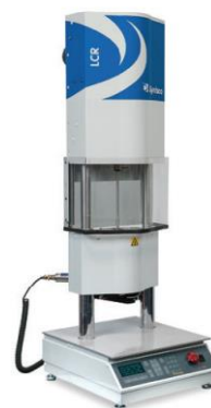
Laboratory Capillary Rheometer