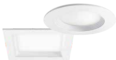
ELSA i et rundt eller kvadratisk kabinet

FLAT-sensorerne styrer ikke kun belysningen, men giver også rummets æstetik det rigtige lys – især i et harmonisk samspil med diskrete downlights som ELSA- eller STINA-modellerne fra ESYLUX.