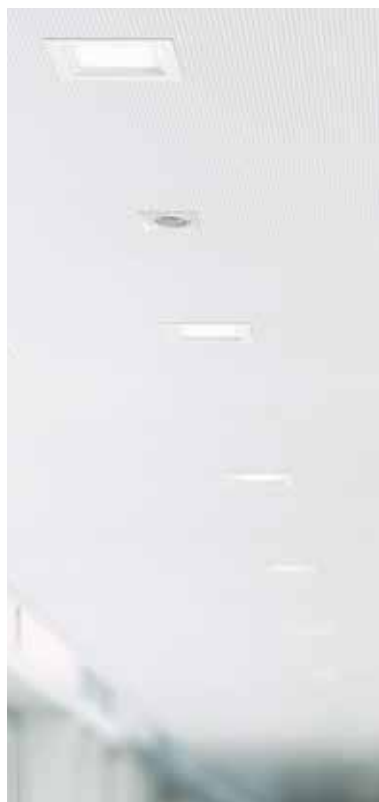
PD-FLAT 360i/8 GLASS SQUARED WHITE, ELSA 125