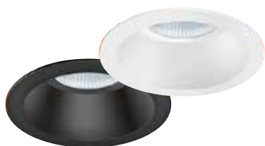
STINA fås i sort eller hvid