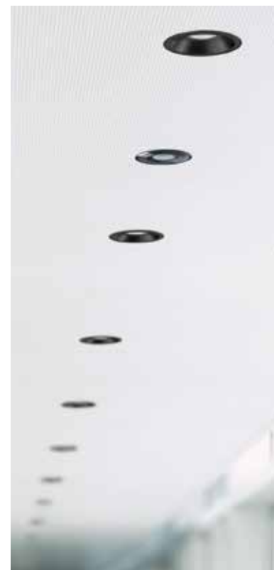
PD-FLAT 360i/8 GLASS ROUND BLACK, STINA 90