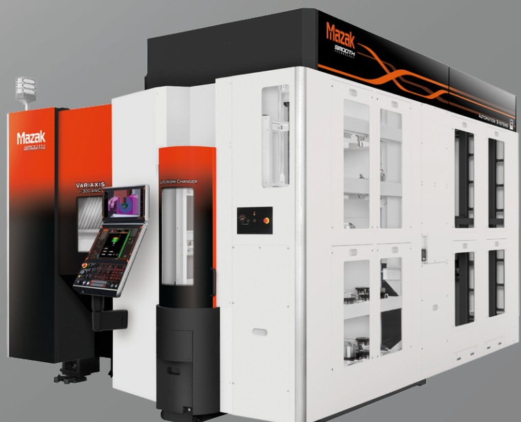
VARIAXIS i-300 AWC