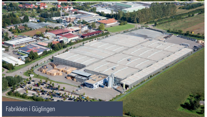
Fabrikken i Güglingen