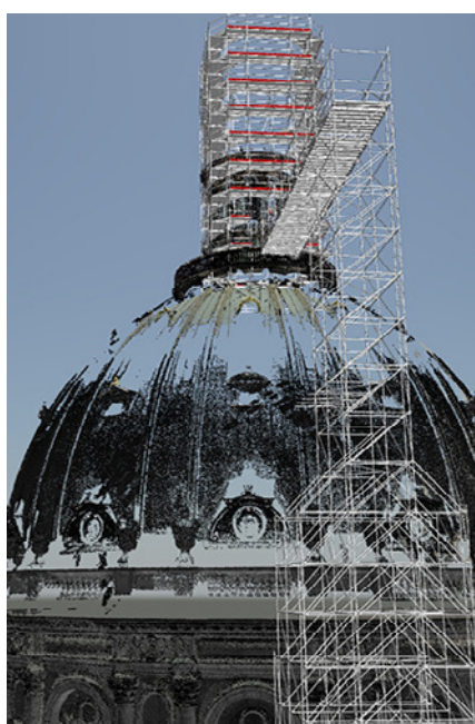
Stilladset designet ud fra Point Cloud-scanningen.