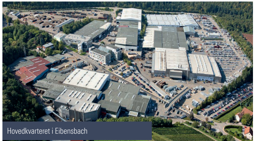
Hovedkvarteret i Eibensbach