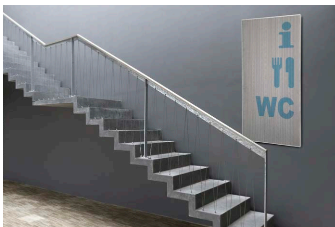
Integrer DAMPA® Silent Board i indretningen som f.eks. infoskilt