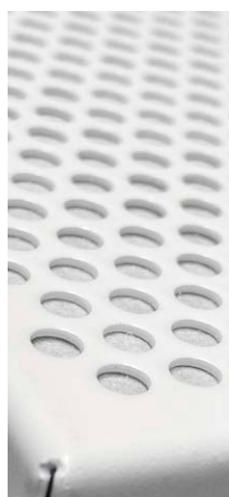
Hvid, perforation Ø 8 mm