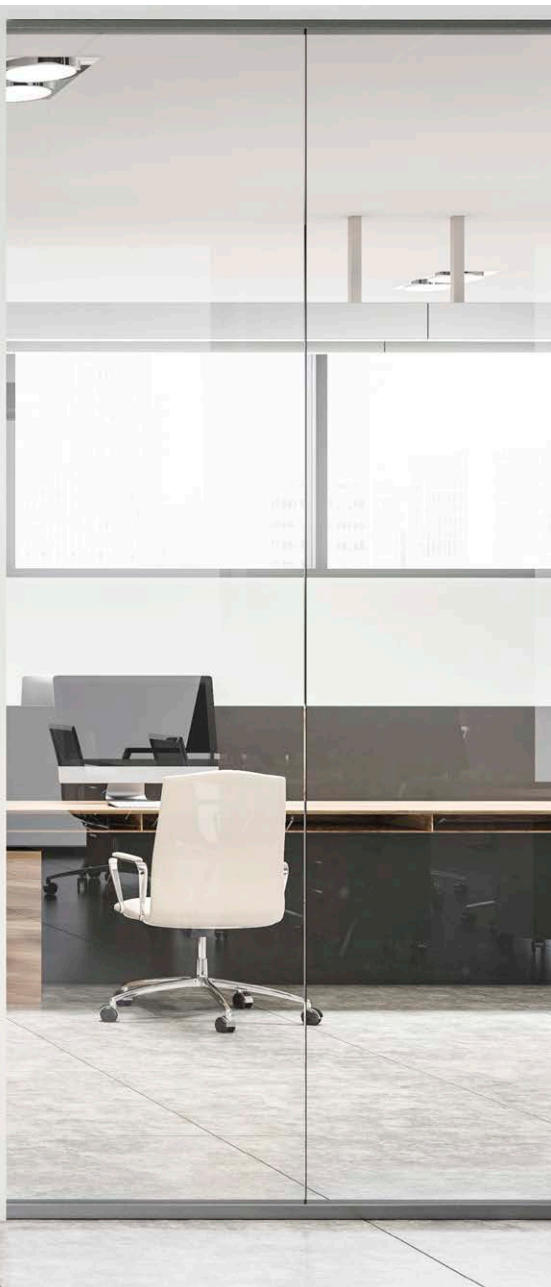
DAMPA® Silent Board fås med digital print, så vægpanelerne både forbedrer akustikken og giver et personligt udtryk.