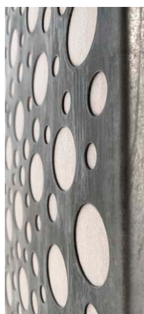
Bruneret, art perforation