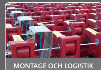
MONTAGE OCH LOGISTIK