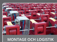
MONTAGE OCH LOGISTIK