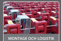
MONTAGE OCH LOGISTIK