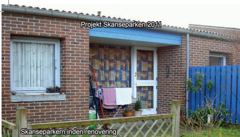
Skanseparken inden renovering