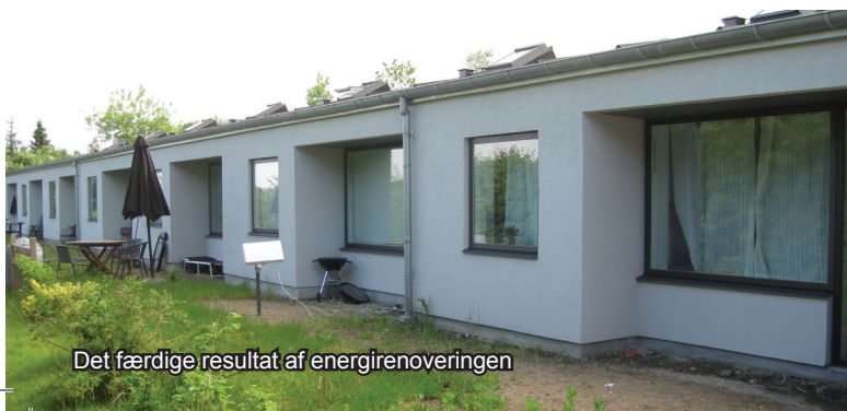
Det færdige resultat af energirenoveringen

Der er meget at spare ved at energioptimere boligen. Ikke mindst sparer du miljøet for overbelastning af CO 2 , men også rent økonomisk er der en gevinst.