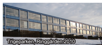
Trigeparken, Ringgården 2010