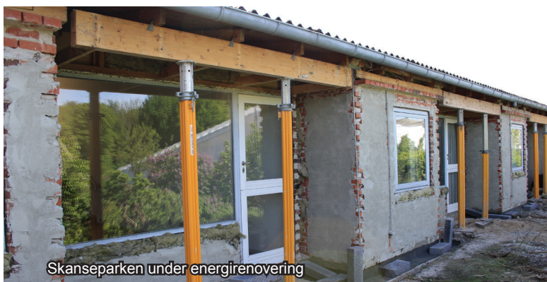
Skanseparken under energirenovering