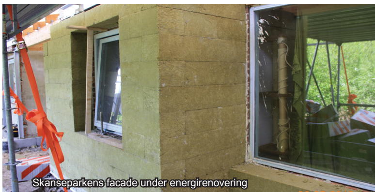
Skanseparkens facade under energirenovering