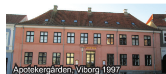
Apotekergården, Viborg 1997