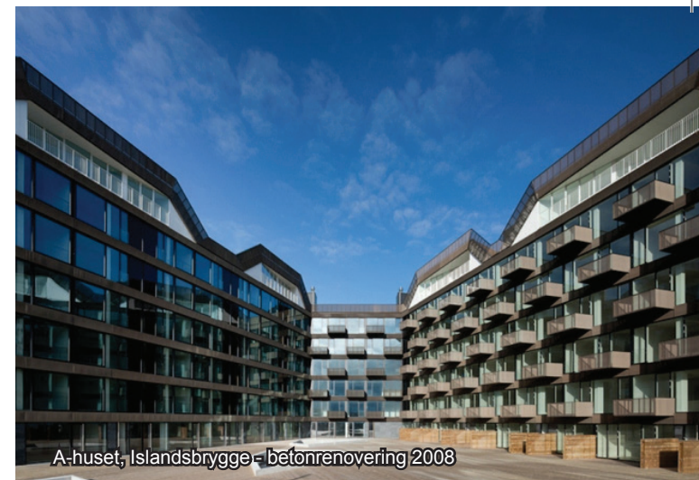
A-huset, Islandsbrygge - betonrenovering 2008

Vi i HUJ A/S har mange års erfaring inden for renovering og vedligeholdelse, hvilket gør, at vi kan sikre, at udførelsen af den valgte opgave bliver fremført i højeste kvalitet. Vi arbejder med omtanke og tager, så vidt det er muligt, hensyn til både beboere og omgivelserne omkring byggepladsen.