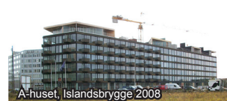
A-huset, Islandsbrygge 2008