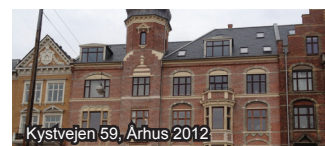
Kystvejen 59, Århus 2012