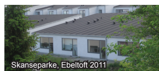
Skanseparke, Ebeltoft 2011