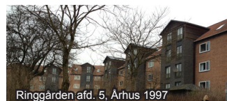
Ringgården afd. 5, Århus 1997