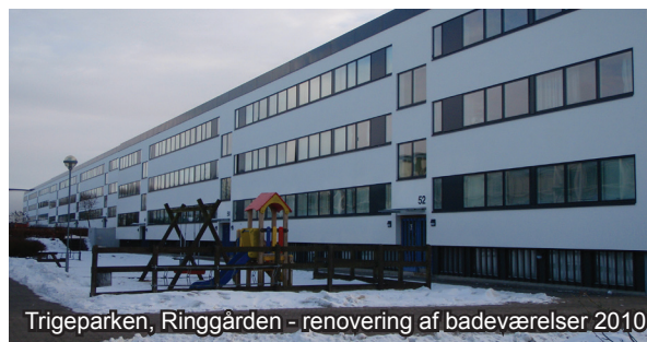
Trigeparken, Ringgården - renovering af badeværelser 2010

For at sikre lang levetid af bygningerne er det et must, at renoveringsarbejderne og vedligeholdelse udføres korrekt af kompetente håndværkere, som har respekt for bygningerne, men også for den enkelte beboer, hvor opgaven skal udføres.