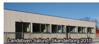
Landsbyen Sølund, Skanderborg 2010