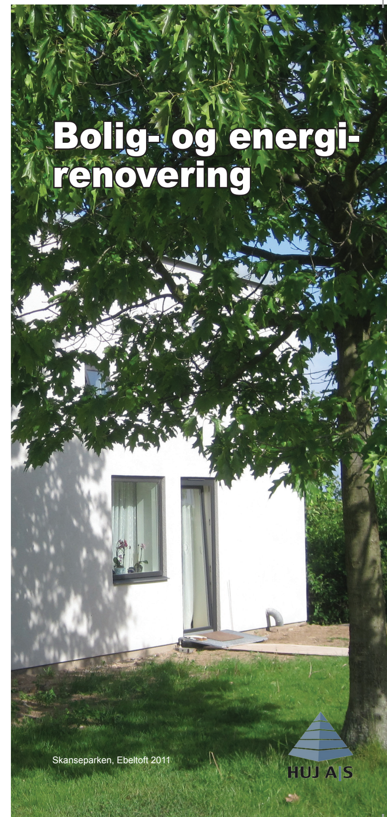
Skanseparke, Ebeltoft 2011