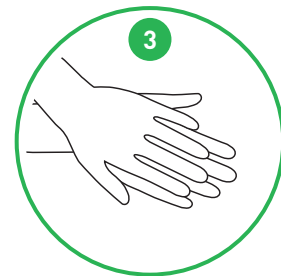
Gnid håndfladerne mod håndryggen