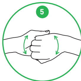
Omkring fingrene og neglene