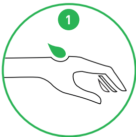
Påfør cremen på håndryggen

- PÅFØRES RENE OG TØRRE HÆNDER EFTER ARBEJDETS OPHØR. BRUGES EFTER HÅNDVASK ELLER VED TØRRE HÆNDER.