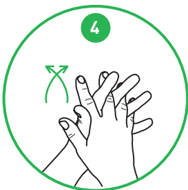
Gnid mellem fingrene