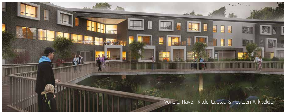
Vonsild Have - Kilde: Luplau & Poulsen Arkitekter

*Alle priser er pr. person ekskl. moms, rabatter kan ikke kombineres.