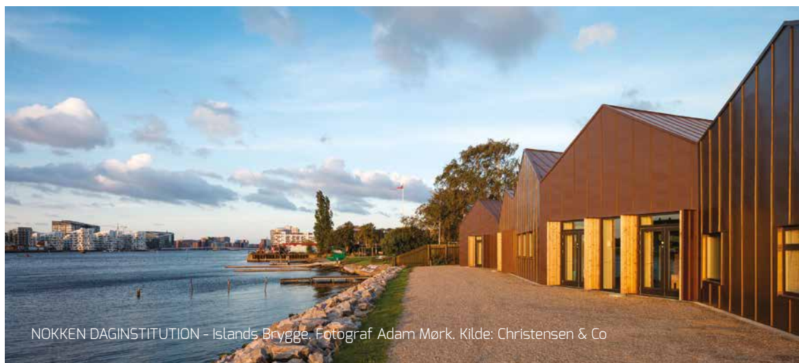
NOKKEN DAGINSTITUTION - Islands Brygge.