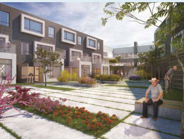
Vonsild Have

Den store udfordring, når vi skal bygge plejeboliger til fremtiden er at skabe boliger, som giver beboerne hjemlige og trygge rammer, samtidig med at de fungerer optimalt som arbejdsplads.