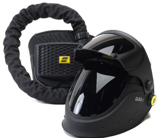
G30 Air med ESAB PAPR