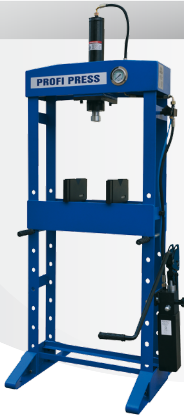
30 TON HF2