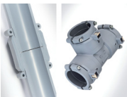
Flexalen 600" Dimensioner