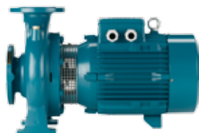
GG20 Støbejern PN10 Max. 90/120° 25-65 mm 0.25-5,5 kW