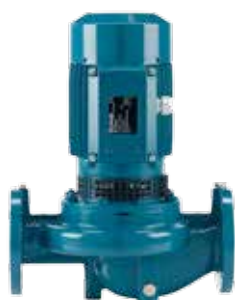
GG20 Støbejern PN10 Max. 90/120° 32-65 mm 0.37-4,0 kW