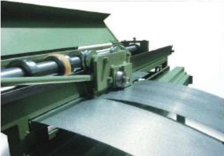
Rullesaks for af-klipping af kørt bane