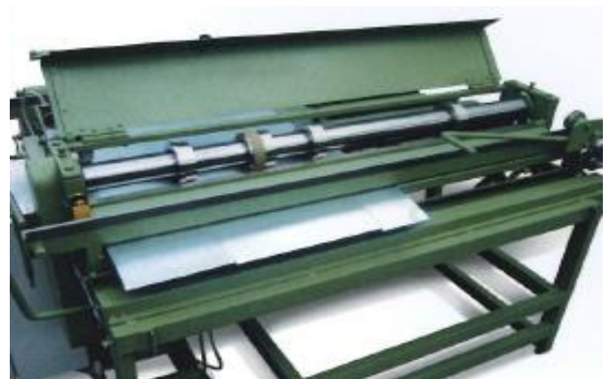
3 sæt justerbare knive for flere mål i same arbejds gang.