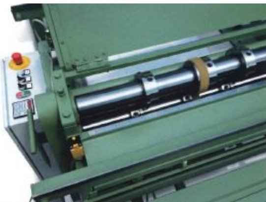
Trinløs og nem indstilling af knive.