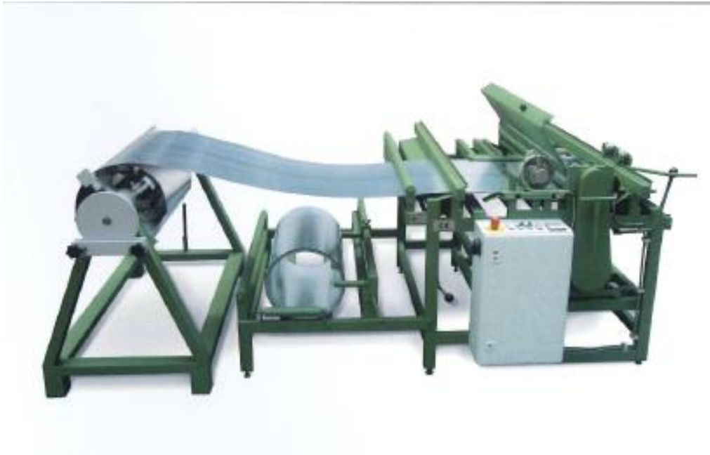
Spalteanlæg vist med tilbehør.