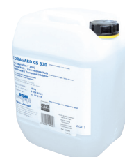
ref. 052246 Vätske-kylare CORAGARD CS 330 - 10 l