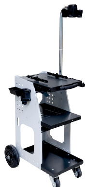
ref. 051331 + 052284 SPOT 800 + Överhängande arm