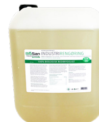
BioSan Industri Rengøring