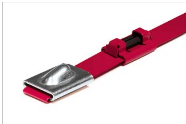
MBTRFID - rustfri RFID stålbindere til aggressive miljøer.