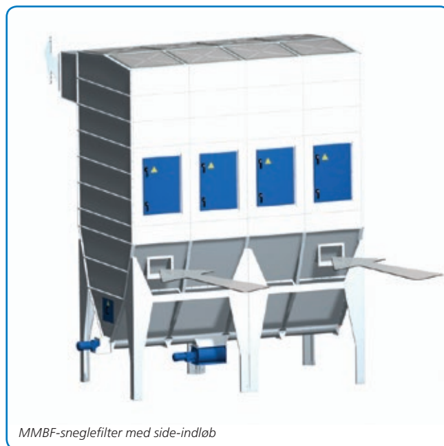
MMBF-sneglefilter med side-indløb