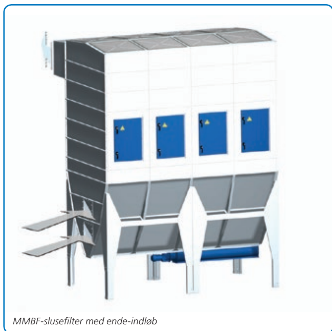
MMBF-slusefilter med ende-indløb

MMBF-slusefilteret kan leveres fra 1 til 4 moduler og leveres med JK-50S, JK-100S, JK-150S eller JK-200S.