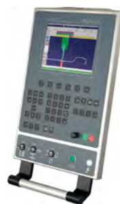
ModEva 10 2D Windows