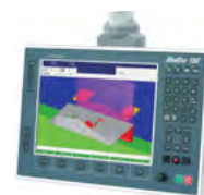
ModEva RA 3D Windows