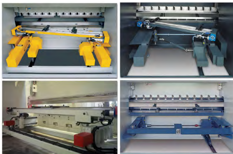
Systemer af pladeanslag