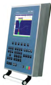
Cybelec DNC 880 2D Windows