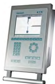
Delem DA-56 2D Windows