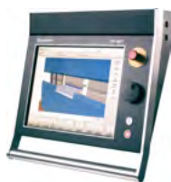
Delem DA-66T 3D Windows