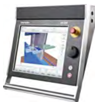
Delem DA-69T 3D Windows