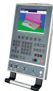
ModEva 12 3D Windows