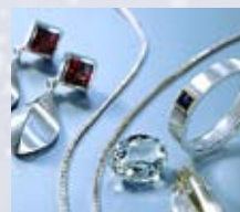
Ultralyds rensning i guldsmedeværksteder