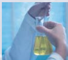
Rensning, afgang og dispergering i laboratoriet