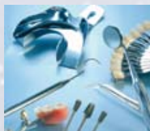
Rensning i dental og medicinsk sektor