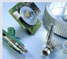
Rensning af emner i industri, værksteder og serviceafdelinger