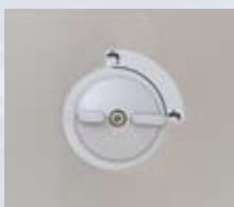
Drejeknap til åbning af afløbet

Elmatronic S rensekar kan fås i 13 forskellige størrelser, fra 0,5 liter til 90 liter. De er forsynet med effektive 37 kHz højtydende ultralydstransducere af nyeste generation.