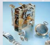
Ultralyd i urmagerbranchen

■ Laboratorium: Ultralyds rensning overalt hvor rensvæsken kan trænge ind. Det er især anvendeligt til rensning af laboratorie instrumenter lavet af glas, plastik eller metal. Elmasonic S renskar afgasser HPLC (high-performance liquid chromatography) opløsninger, blander, dispergere, emulgere og opløse præparater.