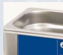
Mærkning for max. fyldning

■ Den valgfri tørdriftssikrer opvarmning understøtter renseprocessen