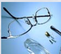
Ultralyd til øjenlæger og optikere