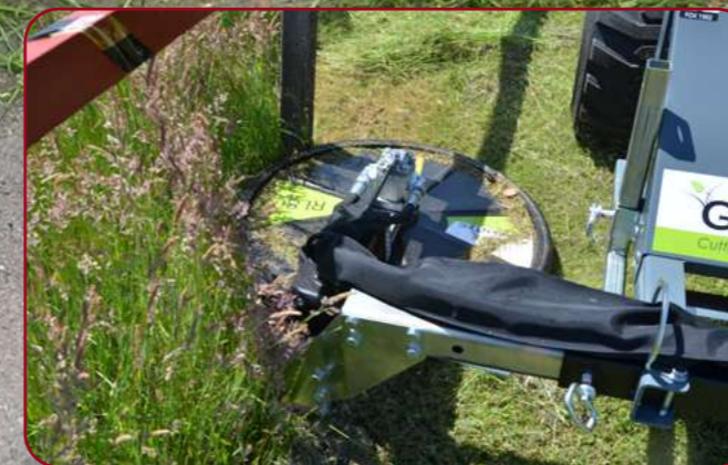
FOX med kant- & stolpklippare RI 80