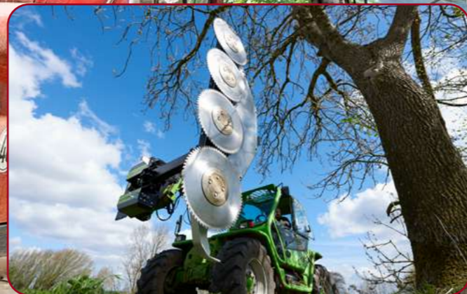
HXF 3302 med grensåg LRS2402