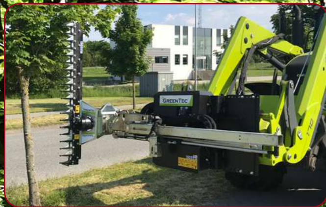
HXF 2802 Tele med häckklippare HL 152