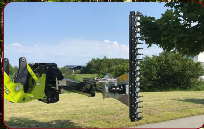
HXF 2802 Tele med häckklippare HL 152