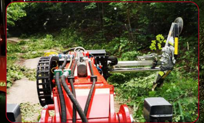
HXF 2802 Tele med grensåg LRS 1602