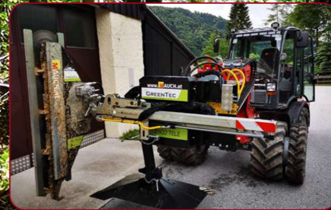
HXF 2802 Tele med grensåg LRS 1602