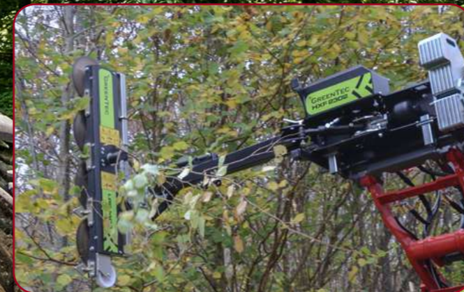
HXF 2302 med grensåg 1402