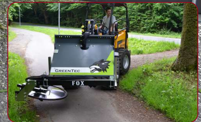
FOX med kant- & stolpklippare RI 80