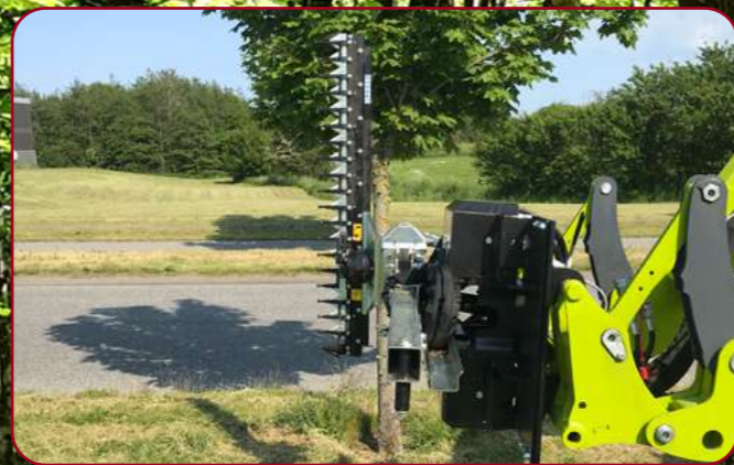
HXF 2802 Tele med häckklippare HL 152