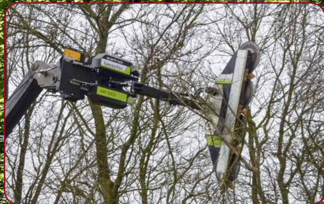
HXF 3302 med grensåg LRS 2002