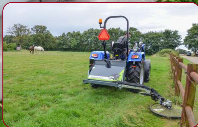
FOX monterad på traktorns 3 punkts fäste med kant- & stolpklippare RI 80