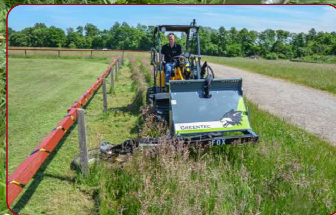
FOX monterad på lastare med kant- & stolpklippare RI 80