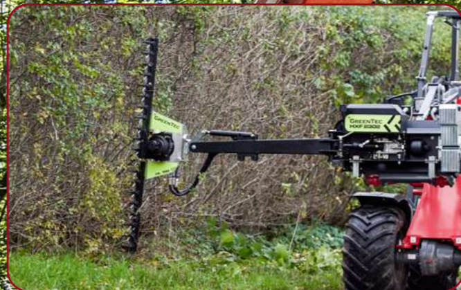
HXF 2302 med häckklippare HL152