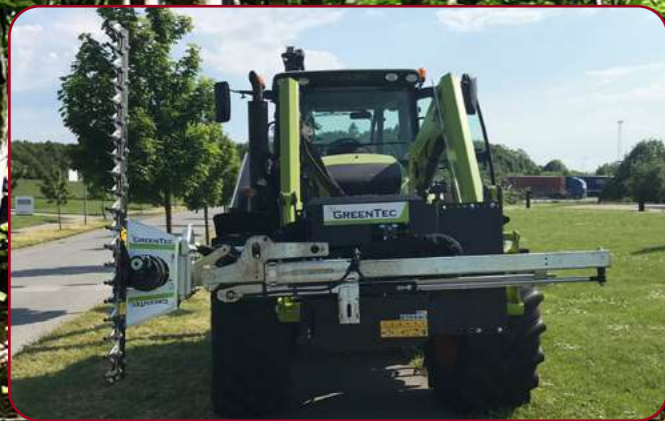
HXF 2802 Tele med häckklippare HL 152