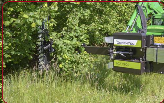
HXF 2802 med häckklippare HS172