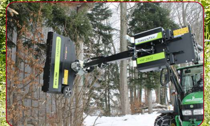
HXF 2802 med häckklippare RC132