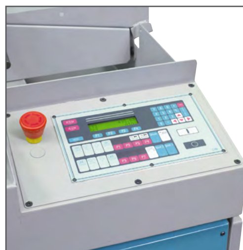
Tastatur til CNC automatisk båndsav