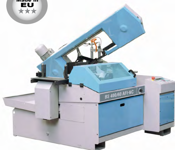
BS 400/60 AFI-NC

Elektronisk og CNC automatiske båndsave, hydraulisk styrede; smigskæring fra 0° til 60° til venstre. Støbejerns savbue med rørformet sektion med elektronisk veksleretter for variabel klingehastighed.