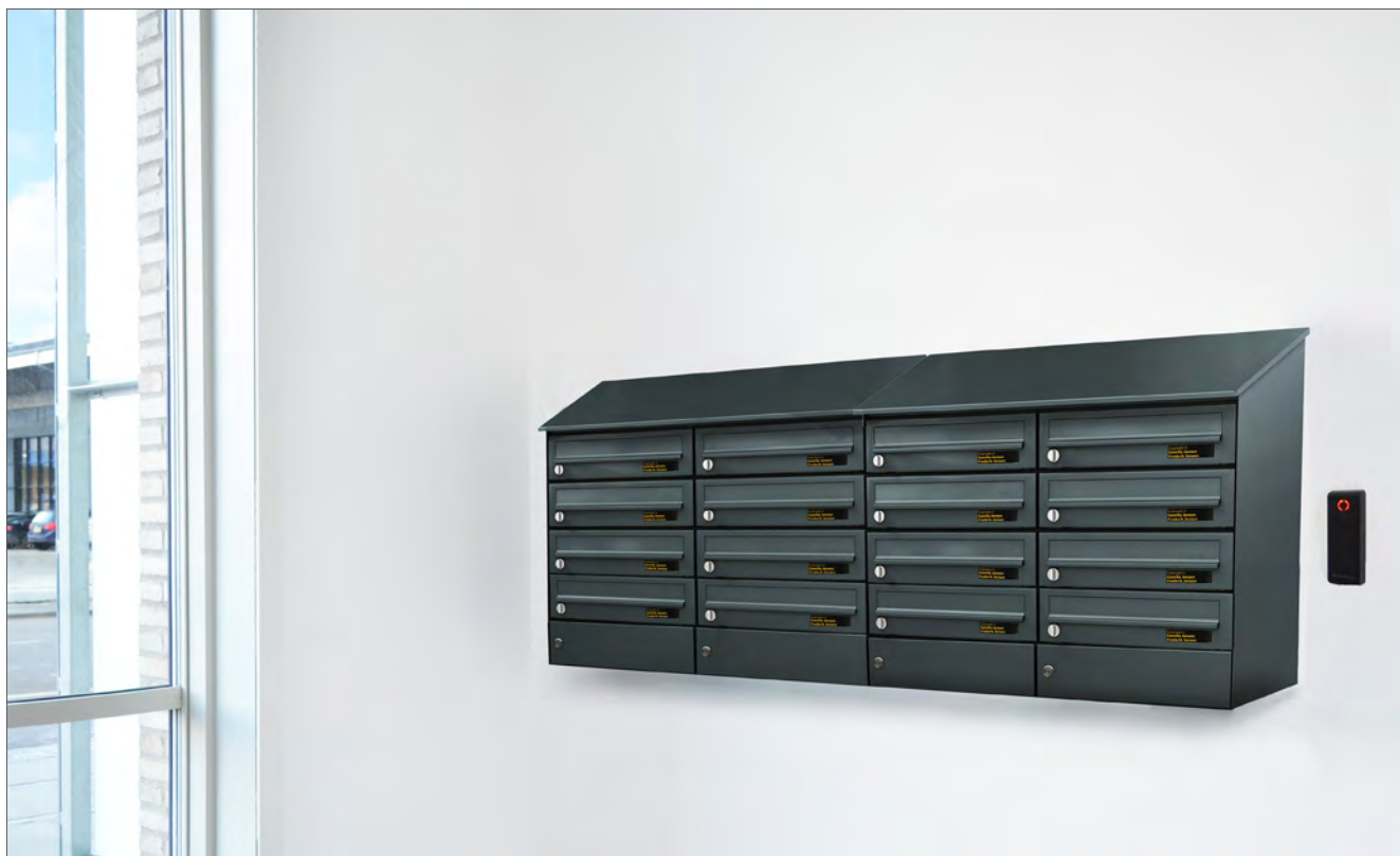
Forbehold for trykfej og produktmodifikationer