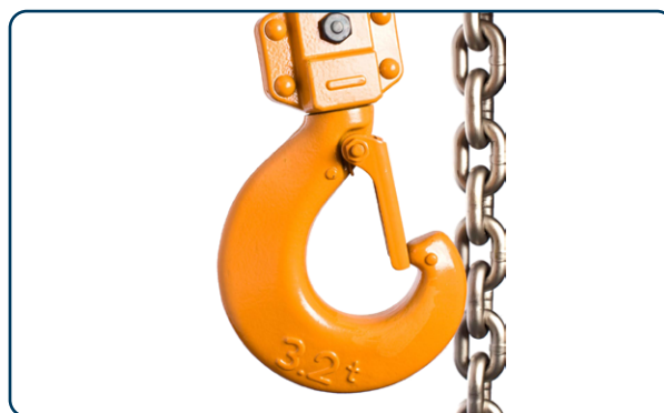
Varvskrok finns som tillval till spaklyftblocket