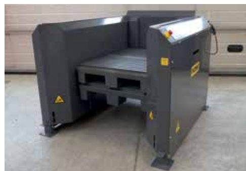
1060x750x175 mm paller

Virksomheder som Grundfos, Carlsberg, Coca Cola, Volvo, Nestlé, Chanel, Haribo, Pfizer, Siemens og Miele bruger allerede PALOMAT® til at effektivisere deres palleflow.