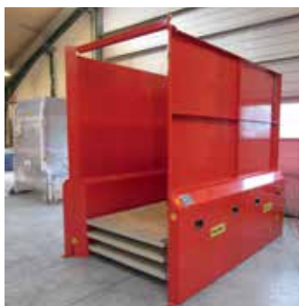
2400x1200x160 mm platforme