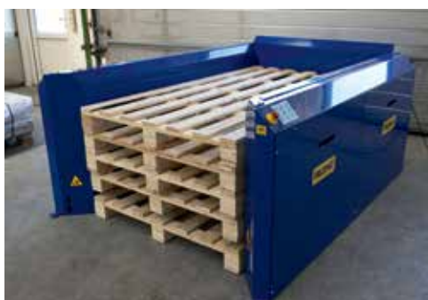
2015x900x137 mm paller

Kontakt din forhandler og lad dem finde PALOMAT® - løsningen til netop dit palleflow