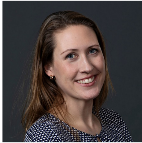
Partner i DLA Piper advokatpartnerselskab

"Udbudsspillet er en sjov og lærerig måde at blive introduceret til udbudsprocessen på og blive bevidst om, de mange beslutninger ordregiver og tilbudsgiver skal træffe. Vi vil gerne være med til at understøtte innovative tiltag, som kan hjælpe offentlige indkøbere og tilbudsgivere med at træffe de rigtige beslutninger. Udbudsspillet er en fremragende indføring til offentlige udbud forud for Nohrcons udbudskurser og certificering i udbudsret - og en sjov reminder til rutinerede indkøbere."