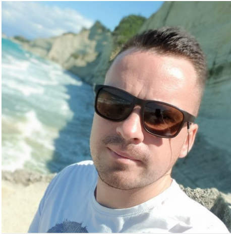
Salgsingeniør i Demek CNC

"Udbudsspillet var en øjenåbner for mig. Det gav en unik mulighed for at sætte mig i både en offentlig myndigheds og et privat firmas sted, hvilket gjorde det muligt for mig at forstå de udfordringer og finesser, de står overfor. Den indsigt, jeg har fået fra spillet, har ikke kun beriget min viden om udbudsprocessen, men har også givet værdifulde strategier til at skræddersy mine tilbud effektivt, hvilket gør mig til en mere velinformeret og konkurrencedygtig aktør på markedet."