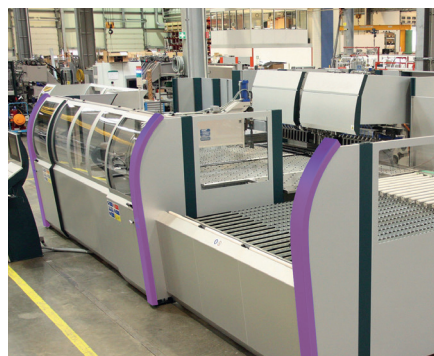
Bockade skyddsprofiler säkerställer här användningssäkra plåtbearbetningsmaskiner.