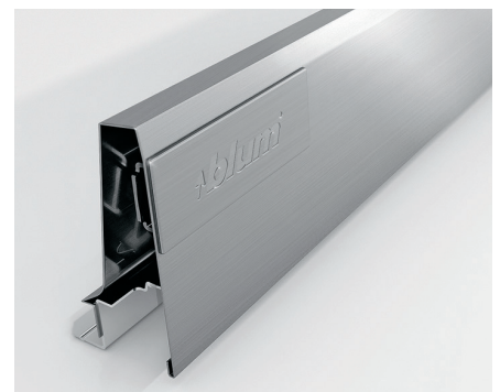
För en ljudlös, funktionell lådrörelse är oklanderliga kvalitetsprofiler en förutsättning som även avgör den estetiska presentationen.