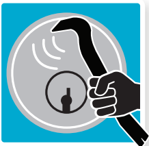
Sikret mod udtræk