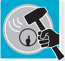
Sikret mod slag