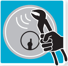
Sikret mod vridning