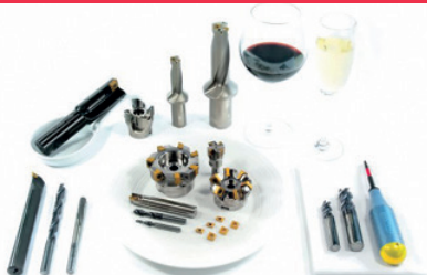
Skærende værktøj á la carte