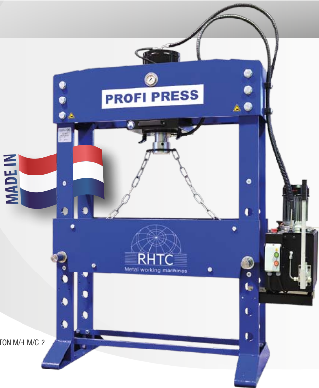
30 TON M/H-M/C-2