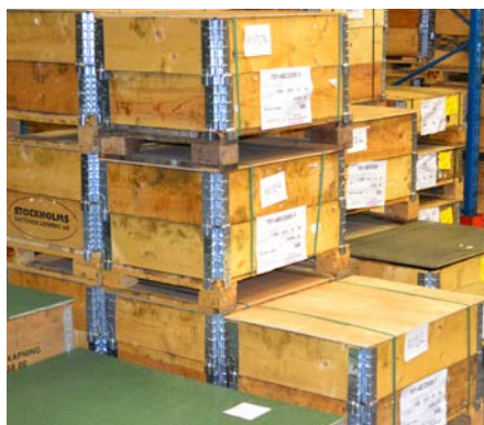
Gods klart för leverans.