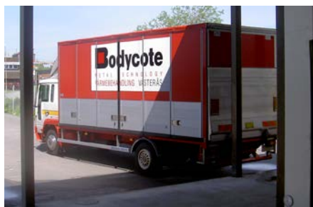
Vill du också gärna veta när ditt gods är färdigbehandlat och på väg till dig?