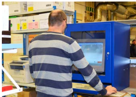
Ordern registreras i vårt system.

Och när ni använt tjänsten en tid så tar vi gärna emot synpunkter på förbättringar av detta system för att utveckla kundservice ännu mer.